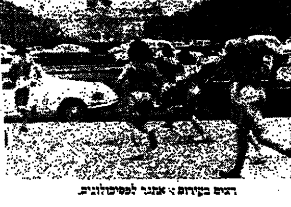
היום בקירום: אנשי לפיטווג'ה

הוא קולם של האיכפתניקים מגיעים לאוני המנהיגים... (Text continues with commentary on religious and political issues)